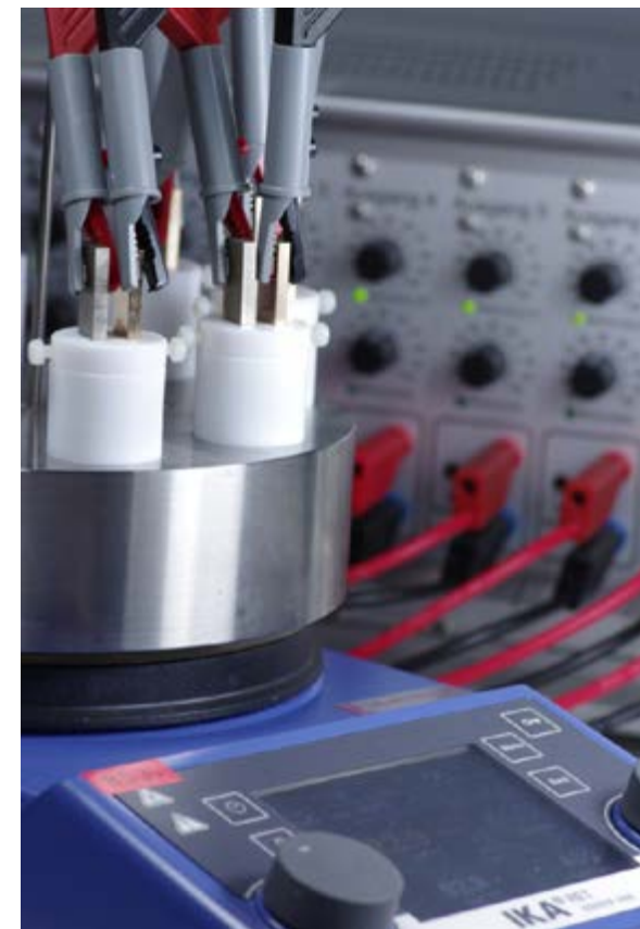
Bis zu acht verschiedene Versuche können gleichzeitig in diesem Screening-Elektrolyseur durchgeführt werden. In jedem der kleinen Kunststoffbecher stecken zwei Elektroden.